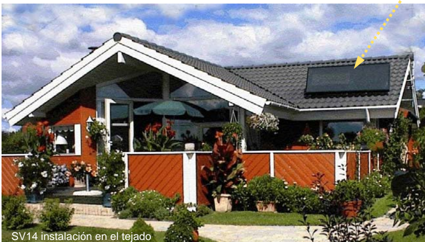
SV14 instalación en el tejado

Nos reservamos el derecho a hacer modificaciones.